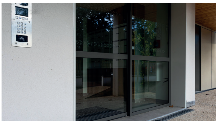
Les Camélias - Bouaye

Dans les programmes neufs, les logements sont conçus pour anticiper les besoins liés à l'âge ou à la perte de mobilité : espaces intérieurs facilitant les déplacements et équipements pouvant évoluer sans travaux lourds, dans le respect des normes PMR (Personne à Mobilité Réduite).