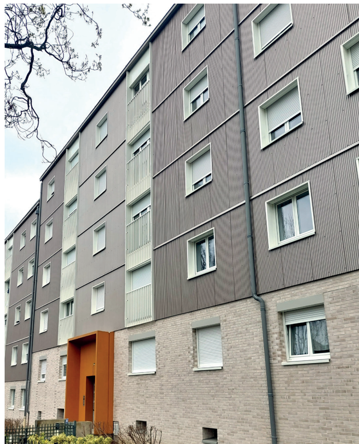
Le Dolmen - Nantes

Enfin, au-delà des opérations de construction et de réhabilitation, La Nantaise d'Habitations réalise chaque année des travaux d'adaptation dans les logements occupés, à la demande des locataires, afin de favoriser leur maintien à domicile. Ces interventions concernent principalement l'aménagement des salles de bain.